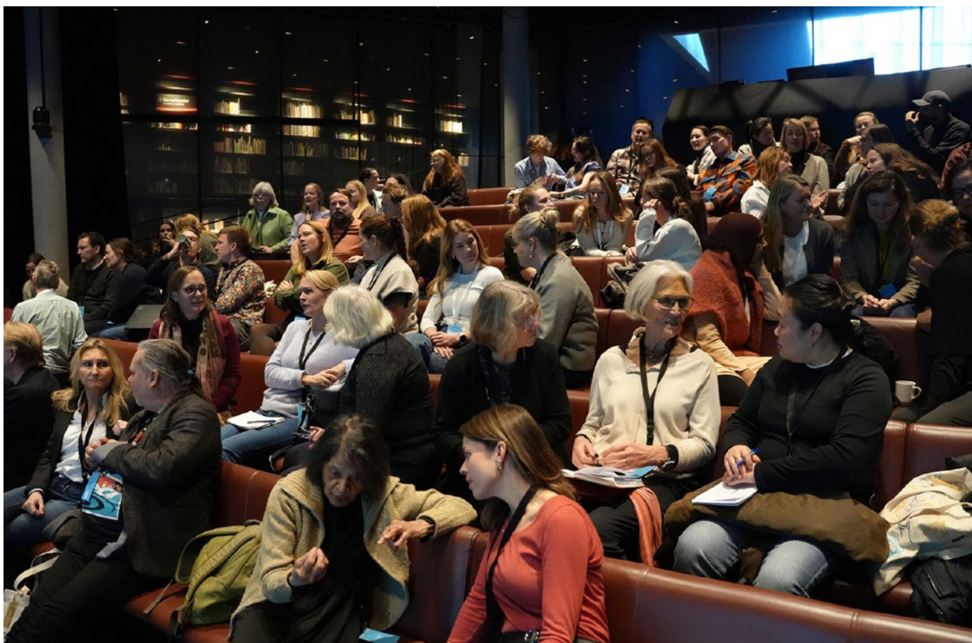
Stort engasjement i salen: Erfaringskonferansen var fulltegnet.

Våre samarbeidspartnere ved UiO: Demokrati publiserte i etterkant en artikkel om konferansen: Demokrati under press: Hva står på spill i klasserommet?